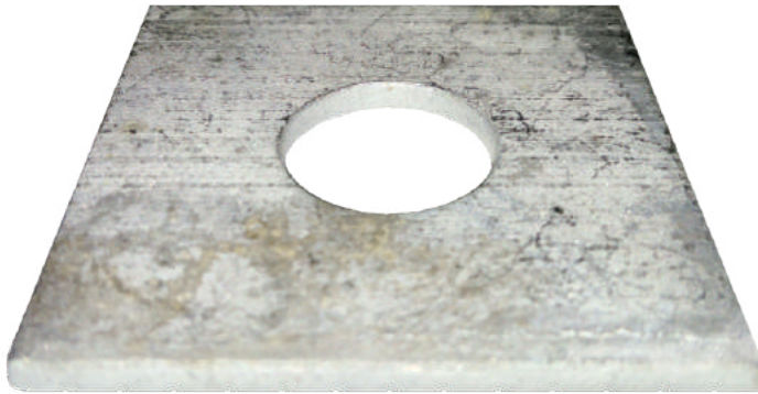
VISTA DE PLANTA